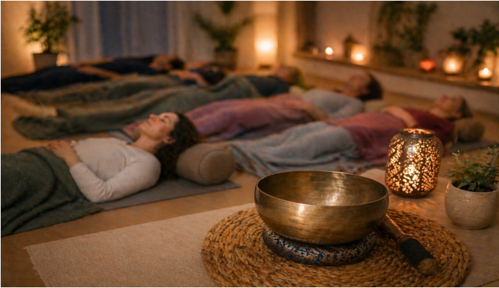
Dieses Bild wurde mit einer KI generiert. 20.03.2026

Zu viel Stress und Anspannung machen krank.