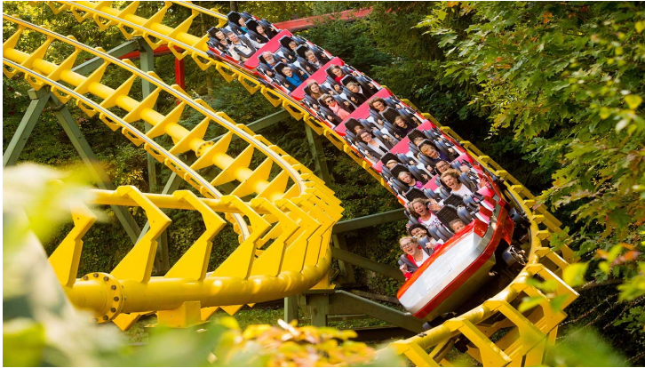
Foto: 20.04.2026 Avonturenpark Hellendoorn - Hondsdol

Besuchen Sie mit uns den Freizeitpark Hellendoorn. Hier gibt es viele Attraktionen und Fahrgeschäfte. Egal ob schnell oder ruhig. Sie können Spaß haben und etwas Neues erleben.