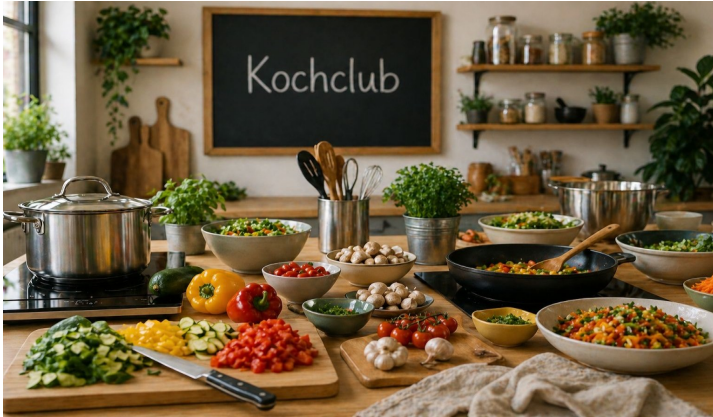
Dieses Bild wurde mit einer KI generiert. 29.04.2026

Wir besprechen gemeinsam die Rezepte, die Sie kochen und backen. Dann bereiten Sie unter Anleitung selbstständig in kleinen Gruppen die Gerichte zu.