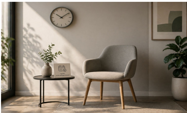
Dieses Bild wurde mit einer KI generiert. 29.04.2026