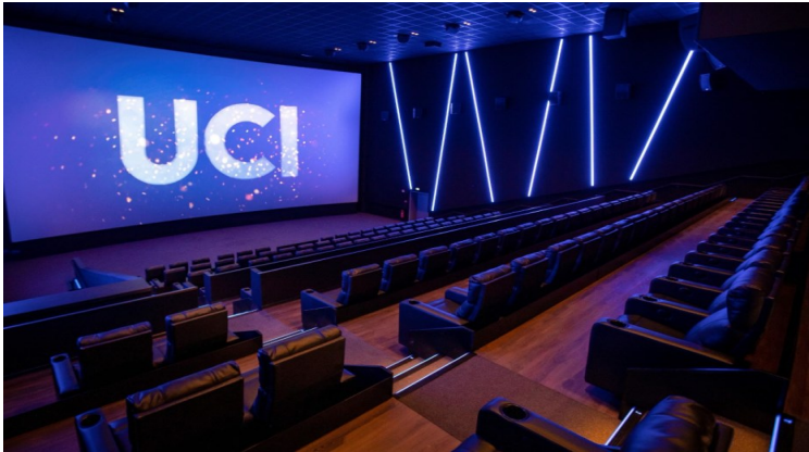
UCI eröffnet vierten Luxe-Standort | Kino | Blickpunkt:Film (blickpunktfilm.de);20.04.2023

Im UCI Kino in Nordhorn schauen wir uns einen Film im Nachmittagsprogramm an.