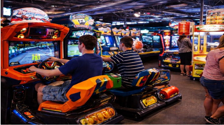
Dieses Bild wurde mit einer KI generiert. 20.03.2026

Besuchen Sie mit uns das Kings Arcade in Nordhorn.