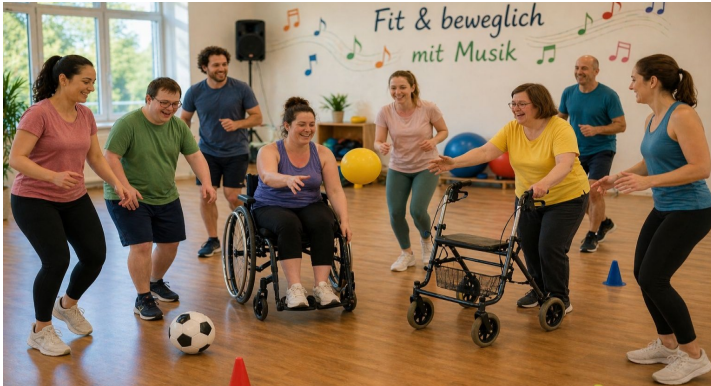
Dieses Bild wurde mit einer KI generiert. 20.03.2026