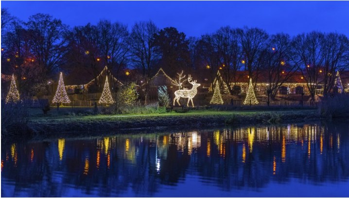
Weihnachtsmarkt im Tierpark 01.-10.12.2023 und 16.+17.12.2023 - Tierpark Nordhorn (tierpark-nordhorn.de)

Im Dezember bieten wir eine Wochenendfreizeit in den Räumen der Offenen Hilfen an.