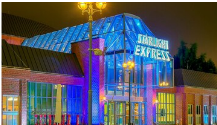
Musical starlight express Stock-Fotos, lizenzfreie Bilder, Vektorgrafiken und Videos

Wir besuchen das Musical Starlight Express in Bochum. Die Schauspieler fahren auf Rollschuhen und singen tolle Lieder. Es gibt bunte Lichter, aufregende Musik und viel Bewegung. Ein Erlebnis, das Sie sicher nicht so schnell vergessen!