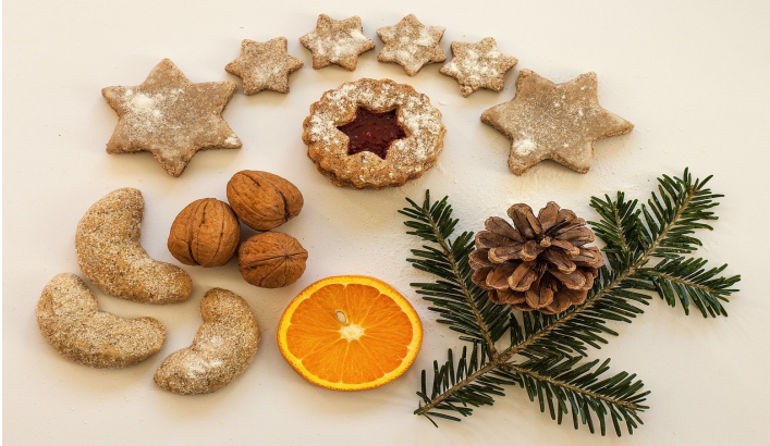
Plätzchen Kekse Kleingebäck - Kostenloses Foto auf Pixabay - Pixabay; 22.04.24

Freuen Sie sich im November auf das vorweihnachtliche Backen. In der Küche duftet es dann nach Anis, Zimt und Nelken. Sie arbeiten unter Anleitung selbstständig in kleinen Gruppen.