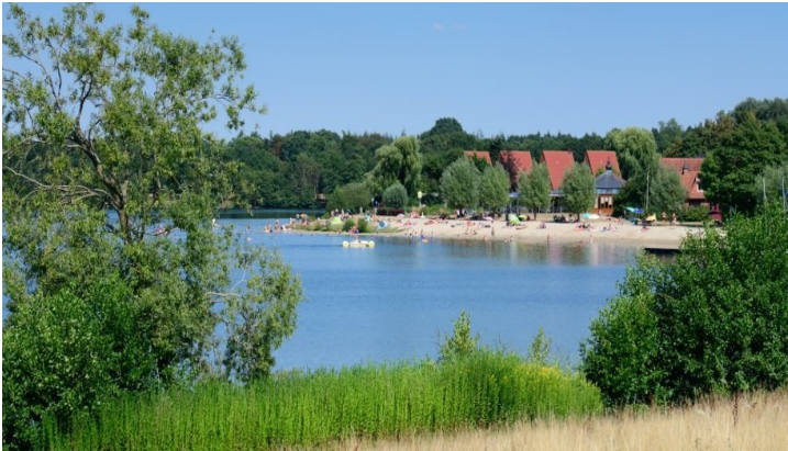
Foto: 20.04.26 Erholungsgebiet Dreiländersee öffnet am Pfingstwochenende | Stadt Gronau

Wir machen einen entspannten Spaziergang am Driland See in Gronau. Genießen Sie die schöne Umgebung und die frische Luft. Danach gehen wir gemeinsam einen Kaffee trinken. Freuen Sie sich auf eine gemütliche Auszeit in netter Runde.