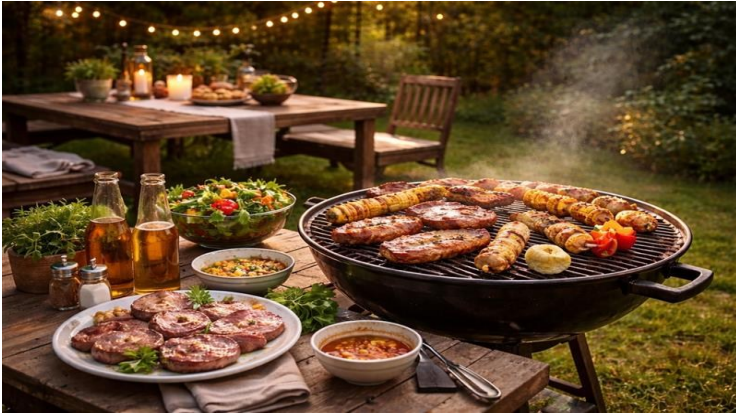
Dieses Bild wurde mit einer KI generiert. 20.04.2026

Verbringen Sie eine gemütliche Zeit beim Grillen. Wir bereiten das leckere Essen gemeinsam zu. Gegrillt wird im Innenhof der Offenen Hilfen.