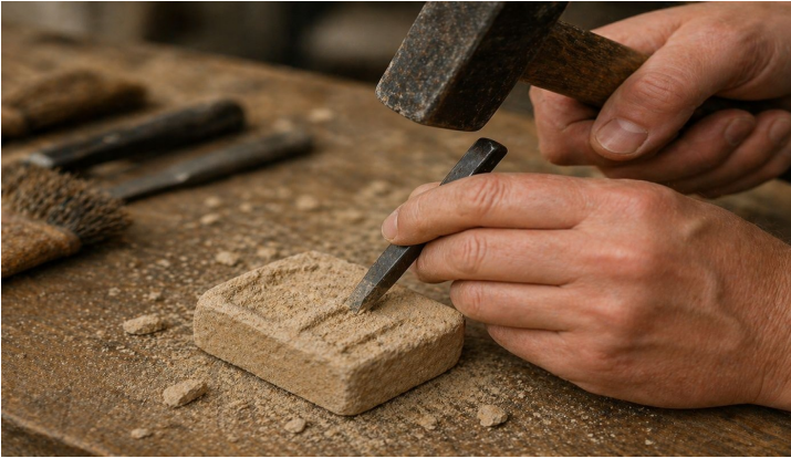
Dieses Bild wurde mit einer KI generiert. 22.04.2026

Wir besuchen den alten Steinbruch „Schlüters Kuhle“ in Bad Bentheim. Hier können Sie kleine Sandsteine mit Werkzeug bearbeiten. Sie können selbst ausprobieren und gestalten.