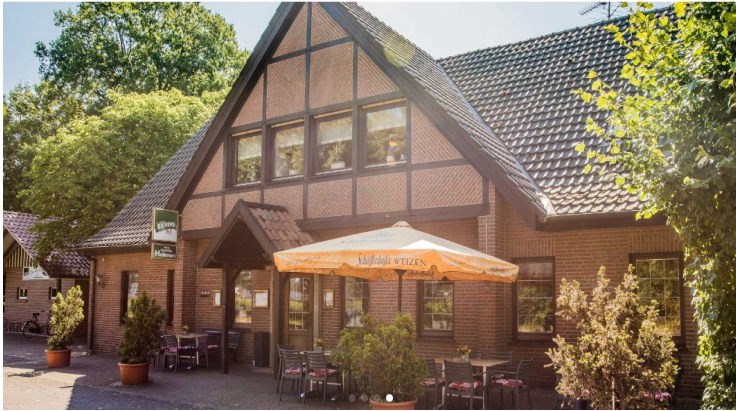
Gaststätte Heilemann | Heilemann ;20.4.2023

Wir kegeln in der Gaststätte Heilemann in Wietmarschen.