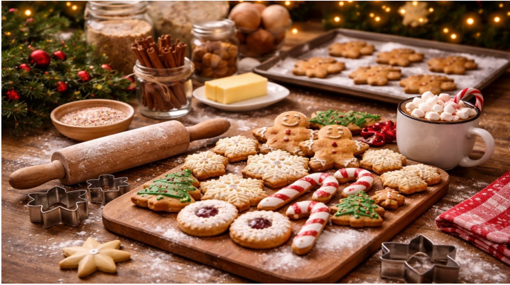
Dieses Bild wurde mit einer KI generiert. 20.03.2026

Freuen Sie sich im November auf das vorweihnachtliche Backen. In der Küche duftet es dann nach Anis, Zimt und Nelken.